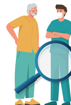
Avec un professionnel de santé