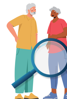
Avec un proche

À la fin du test vous pouvez accéder à des conseils pour rester en forme et préserver votre santé.